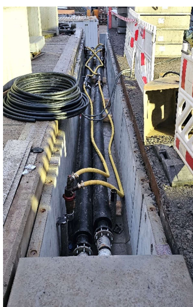
Die Fotos unten links und rechts zeigen die Installation der Kanäle, die rund um die Baustelle verlaufen und die ersten verlegten Leitungen, durch die später die Sole für die Vereisung fließen wird.

Die Bohrungen für die Vereisung konnten in der vergangenen Woche abgeschlossen werden. Das letzte der hierfür benötigten Bohrgeräte wurde abtransportiert und die Montage der Vereisungsleitung im südlichen Bauwerk hat begonnen. Aktuell werden weiterhin Vereisungskanäle errichtet und Leitungen hierin verlegt. Diese werden später an die Vereisungsanlage angeschlossen. Im Süden der Baugrube bis auf Höhe des Rewe-Marktes sind die Vereisungskanäle bereits fertig. In den kommenden Wochen werden die Kanäle und Leitungen in Norden und Osten eingebaut.