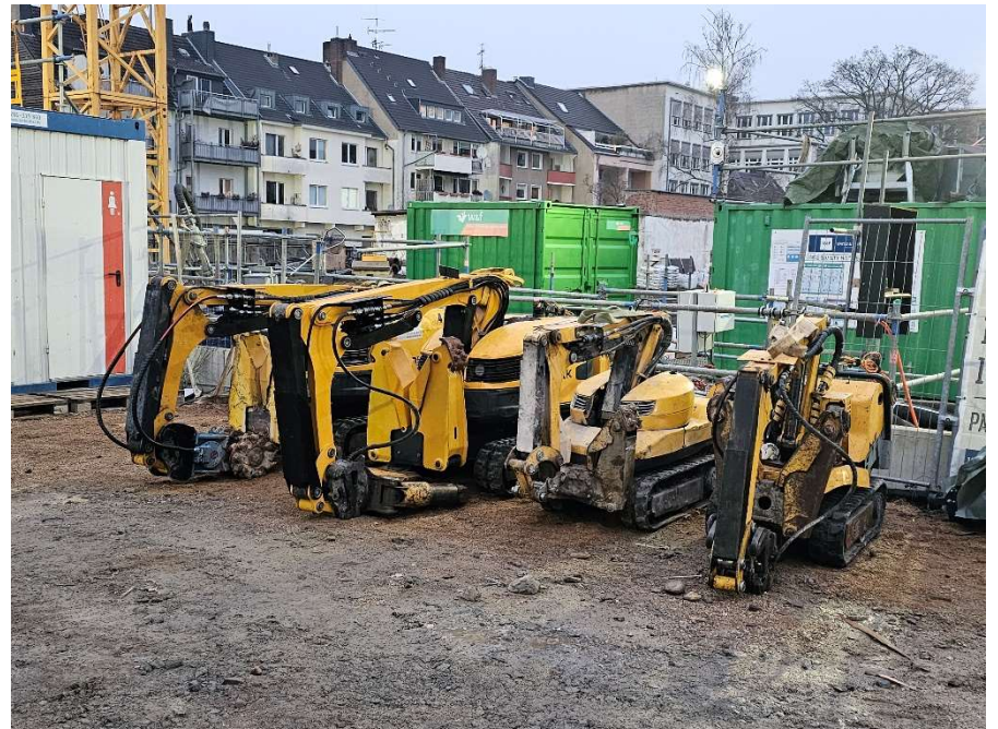
Bereits angelieferte Bohrgeräte für den Abbruch der Decke im Bauwerk.