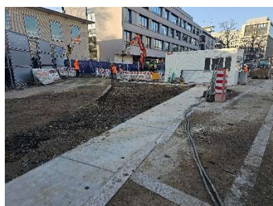
Saugbagger zum Abtragen des Erdreichs vor dem Einbau der Vereisungskanäle (Bild oben links).