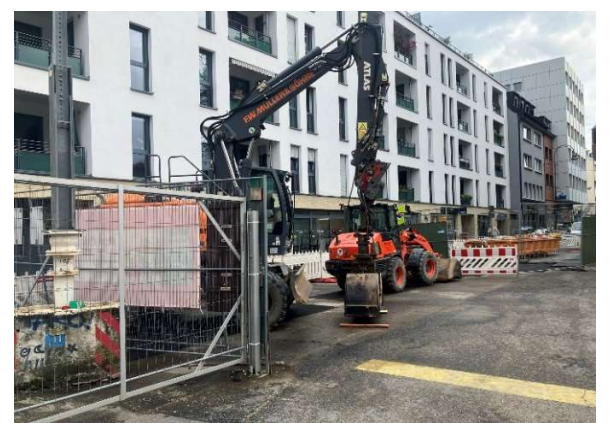
Foto links: Montage und Anschluss der Trafostation ist erfolgt. Lärmintensive Arbeiten am Bestandskopfbalken (Foto Mitte) und der Südseite der Baustelle sind fertig (Foto rechts).

Vergangene Woche wurde eine Kabeltrasse zum Anschluß einer neuen Trafostation hergestellt und durch die RheinEnergie an das Stromnetz angeschlossen. Die zuvor geöffnete Fahrbahndecke wurde nach dem Kabeleinzug wieder geschlossen und die Baustellenabspernung zurückgebaut. Die Brunnenbohrarbeiten innerhalb der Baugrube sind ebenfalls abgeschlossen.