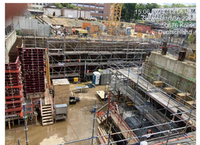
An Wand 4 wird derzeit die Bewehrung hergestellt.