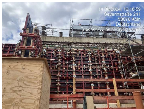
Schalung an Wand 8 vor Friedrich-Wilhelm-Gymnasium.